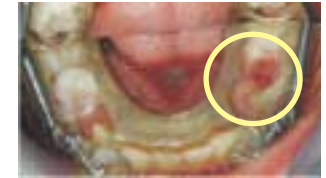
Adapté à tous les stades de la dentition:

La chute des dents lactéales n'interrompt pas le port