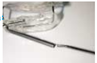
Insérer dans le tube les ressorts coniques de propulsion (3mm)