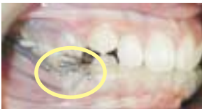
Propulsion douce grâce aux ressorts mandibulaires montés au labo.