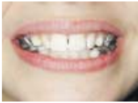
Simple, discret, invisible ne déforme pas le patient

Pour une meilleure coopération en ODF, si on pensait au confort du patient ?